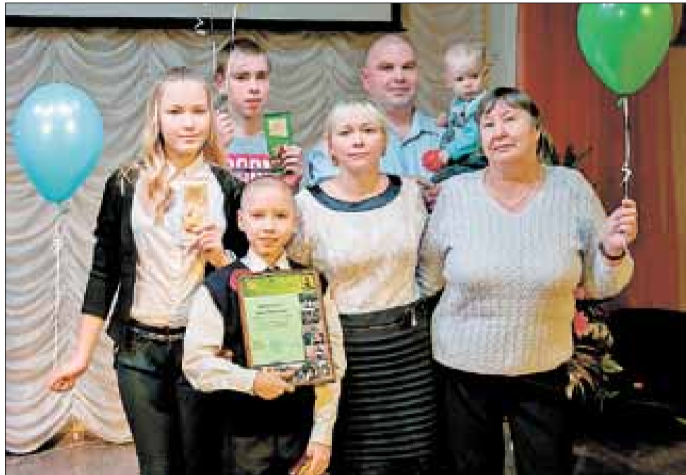
■ Обладателем главного титула стала семья Минькиных.

Домашний очаг: В Архангельске подвели итоги городского конкурса «Вместе дружная семья»