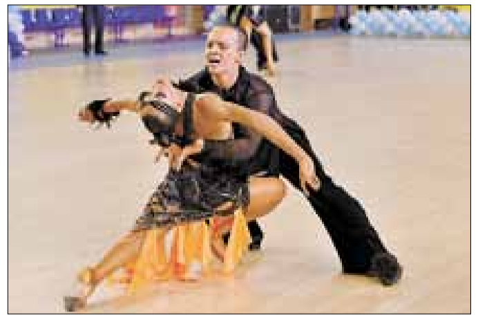
■ ФОТО: ЕЛЕНА МИХЕВА